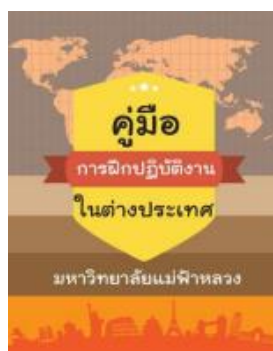
ภาพที่ 2 คู่มือการฝึกปฏิบัติงานในต่างประเทศ

ส่วนจัดหางานและฝึกงานของนักศึกษา ได้จัดทำคู่มือให้นักศึกษาและคณาจารย์ เพื่อให้แนวทางในการดำเนินการสหกิจศึกษาเป็นมาตรฐานเดียวกัน อีกทั้งยังได้จัดทำคู่มือการเตรียมตัวและการใช้ชีวิตในต่างแดนเพื่อใช้เป็นแนวทางเตรียมความพร้อมก่อนเดินทางและการใช้ชีวิตในต่างประเทศ โดยคู่มือจะแนะนำการเตรียมตัวก่อนการเดินทางไปต่างประเทศที่เป็นประโยชน์แก่นักศึกษาสหกิจศึกษานานาชาติ เช่น ข้อมูลสภาพอากาศ การขอวีซ่า การขอหนังสือเดินทาง และข้อมูลติดต่อสถานเอกอัครราชทูตรวมถึงเบอร์โทรศัพท์ฉุกเฉินของหน่วยงานในแต่ละประเทศ เพื่อให้ นักศึกษามีความพร้อมและป้องกันการเกิดปัญหาระหว่างการปฏิบัติงาน