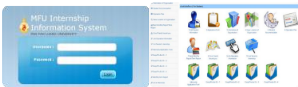
ภาพที่ 6 ระบบ MFU Internship Information System (MIIS)

มหาวิทยาลัยแม่ฟ้าหลวงดำเนินงานสหกิจศึกษานานาชาติอย่างเป็นระบบตามมาตรฐานภายใต้หลักการ PDCA โดยไม่หยุดการพัฒนาศักยภาพในการดำเนินงานสหกิจศึกษานานาชาติเพื่อเป็นการสนองนโยบายมหาวิทยาลัยที่ว่า “มหาวิทยาลัยจะผลิตบัณฑิตที่มีคุณภาพ เพื่อเป็นกำลังสำคัญในการพัฒนาประเทศได้อย่างยั่งยืน”