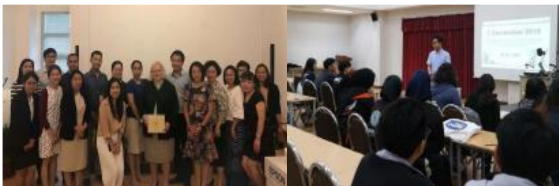
ภาพที่ 5 กิจกรรมพิเศษเพื่อสร้างการเรียนรู้จากประสบการณ์จริง