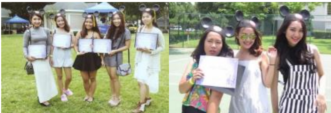
ภาพที่ 4 นักศึกษาที่ได้รับการคัดเลือกให้เข้าร่วมโครงการ Disney International Program

ในปี พ.ศ. 2559 ส่วนจัดหางานและฝึกงานของนักศึกษา ได้ดำเนินการสนับสนุนนักศึกษาสหกิจศึกษานานาชาติตามนโยบายของมหาวิทยาลัยในการผลิตบัณฑิตที่มีคุณภาพในระดับสากล และยังคงคำนึงถึงความปลอดภัยของนักศึกษาทุกคน จึงได้ดำเนินการจัดทำประกันอุบัติเหตุแก่นักศึกษากับบริษัท ไทยไฟบูลย์ประกันภัย จำกัด (มหาชน) ซึ่งหากนักศึกษาประสบอุบัติเหตุระหว่างการฝึกปฏิบัติงานหรือการเดินทาง บริษัทจะให้ความคุ้มครองการประกันภัยอุบัติเหตุแก่นักศึกษาและจะเพิ่มความคุ้มครองให้สำหรับนักศึกษาที่เกิดอุบัติเหตุในต่างประเทศ