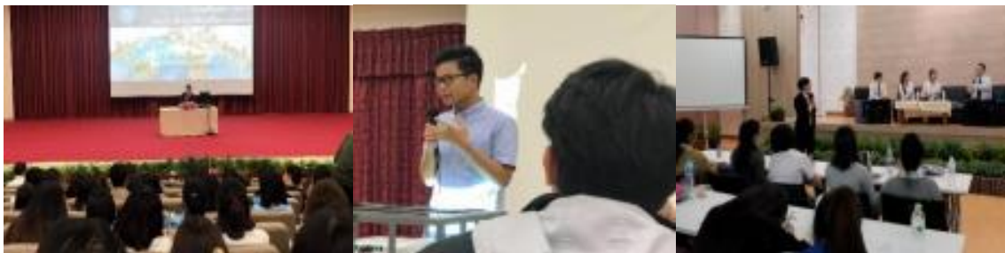
ภาพที่ 1 กิจกรรมการเตรียมความพร้อมนักศึกษาสหกิจศึกษานานาชาติ

นักศึกษาควรตระหนัก ตลอดจนได้รับแรงบันดาลใจและคำแนะนำการเตรียมตัวและการปฏิบัติตัวระหว่างการฝึกปฏิบัติงานจากรุ่นพี่ที่เคยปฏิบัติงานสหกิจศึกษาในต่างประเทศมาก่อน เพื่อนักศึกษาจะได้นำไปประยุกต์ใช้เมื่อออกไปฝึกปฏิบัติงานจริง ณ สถานประกอบการในต่างประเทศ โดยกิจกรรมดังกล่าวจะจัดในช่วงก่อนออกปฏิบัติงานสหกิจศึกษาในแต่ละภาคการศึกษา